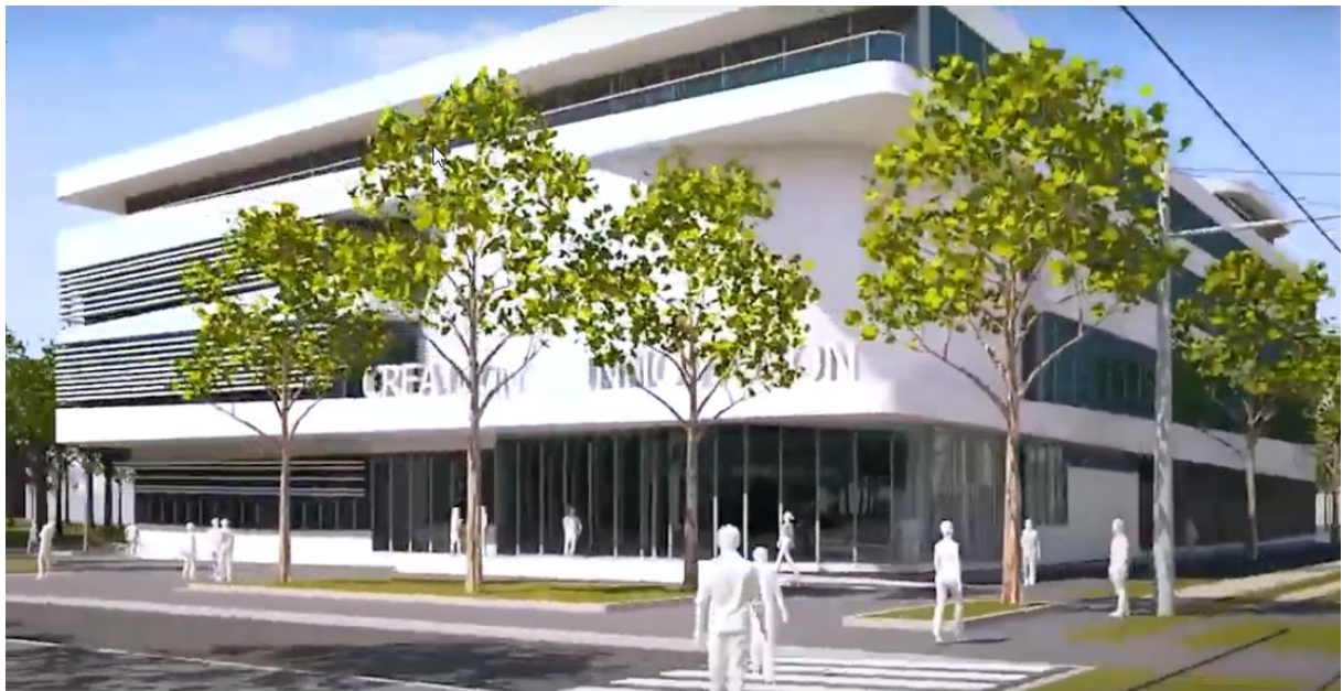
Maison de la Création et de l'Innovation MaCI